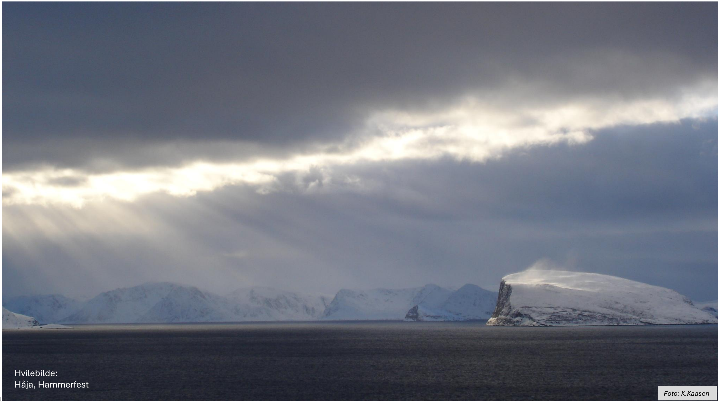
Hvilebilde: Håja, Hammerfest