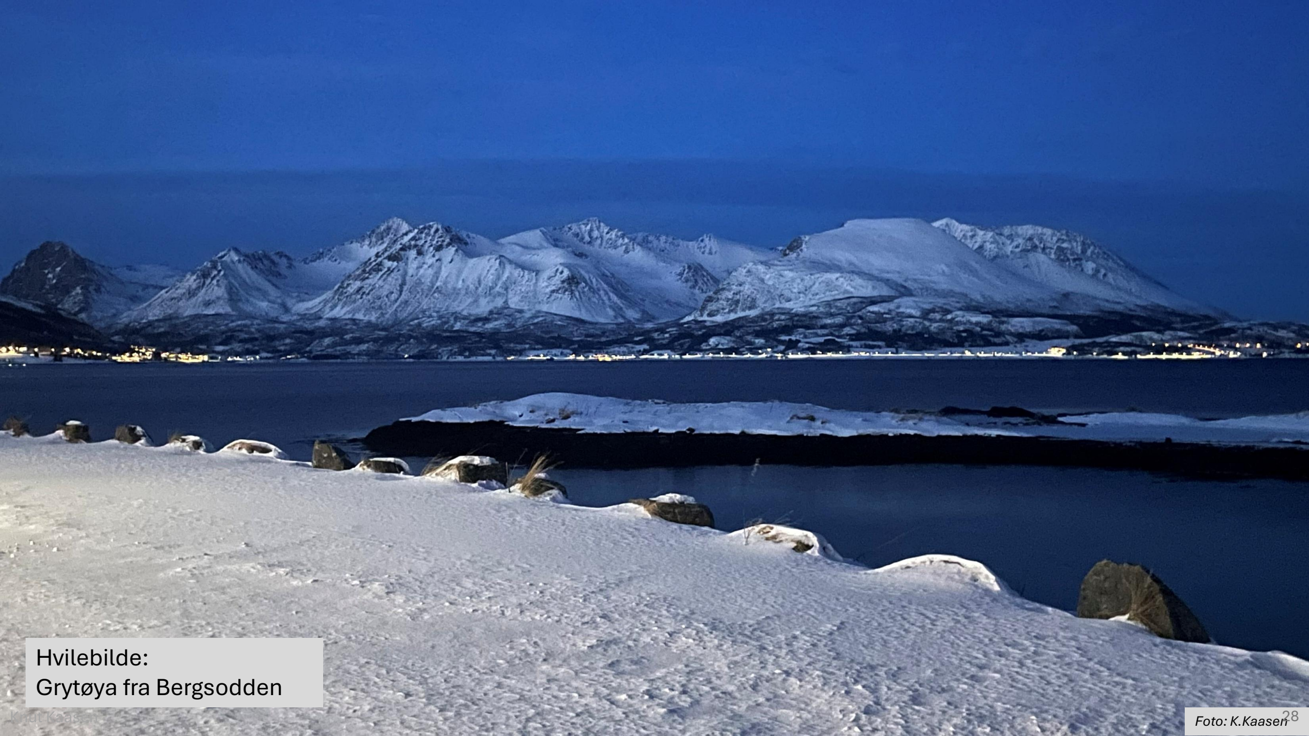
Hvilebilde: Grytøya fra Bergsodden