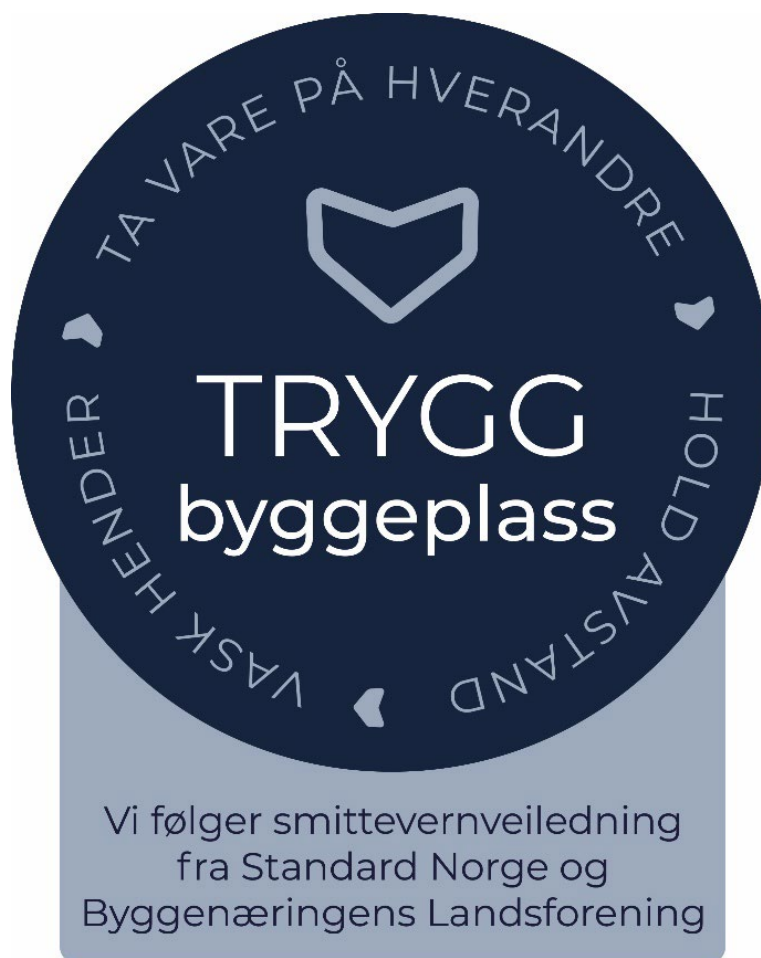
Figur 2 - Trygg byggeplass

Virksomheter som forplikter seg til å følge reglene og gjennomføre tiltakene i dette dokumentet, kan benytte emblemet vist på Figur 2.